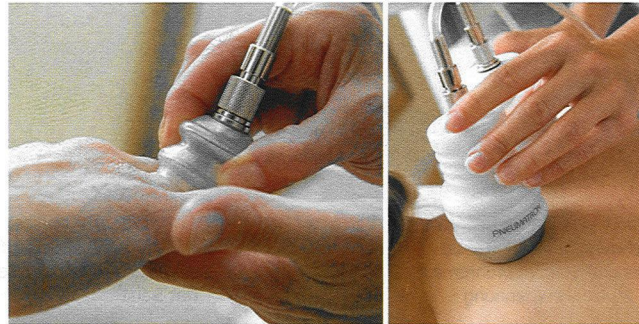
Behandlung der kleinen Gelenke