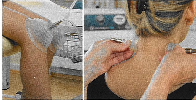
Mobilisation bei Kniebeschwerden